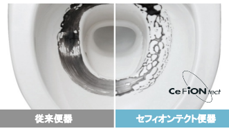
※10年使用相当の便器にて比較。便器内に当社で合成した疑似汚れを塗布した状態。

陶器表面の凹凸を100万分の1mmのナノレベルでツルツルに。汚れが付きにくく、落ちやすいTOTO独自の技術です。